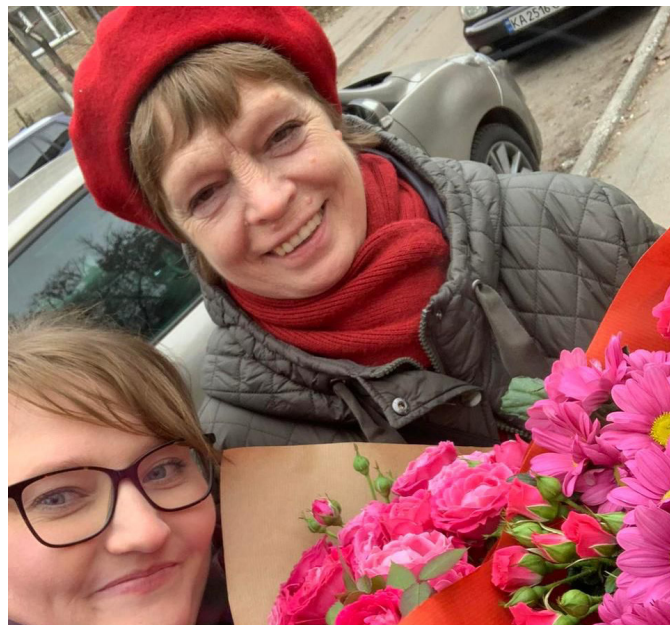
foto boven - vrijwilligers in Oekraïne in het zonnetje gezet op Valentijnsdag

De Nederlandse cultuur, taal, tradities en vooral mensen zijn een groot deel van het leven van de Oekraïners geworden. Ook al is de herinnering aan de dagen van het wegvlugten nog vers, het gevoel van veiligheid dat hier in Nederland werd gevonden helpt om verder te gaan.