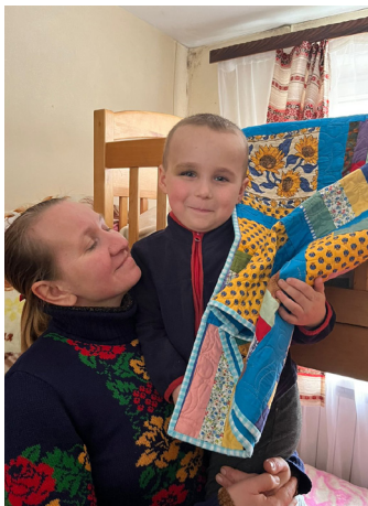
foto's boven - Quilts met het thema Oekraïne