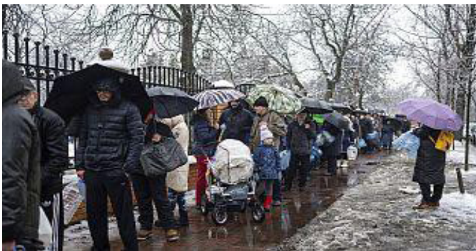
foto boven - mensen in de rij voor hun boodschappen.

Elke dag is hetzelfde en anders tegelijkertijd... We hebben dagelijks te maken met stroomuitval. De momenten van stroom zijn kort, wat maakt dat ik soms maar drie uur per dag heb om te doen wat ik moet doen. Bij winkels, banken en postkantoren staan enorm lange rijen.