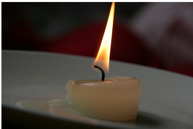
foto boven - De eerste adventkaars staat in het teken van hoop.

Vandaag eerste Advent: wachten op de geboorte van Jezus. We steken de eerste kaars aan; deze staat voor Hoop. Dat hebben we hard nodig. Juist nu we vaak in het donker zitten zonder water en verwarming. Deze hoop daar houden we ons aan vast....