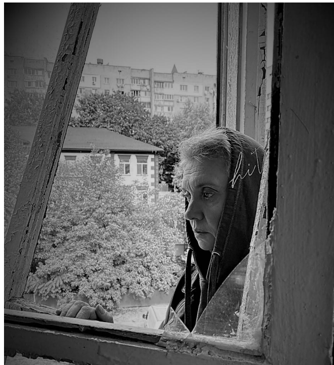
foto boven - kapotgeschoten ramen geven een trieste aanblik.

Deze frasen komen uit een dagboek en zijn geschreven door een inwonster van Kiev.