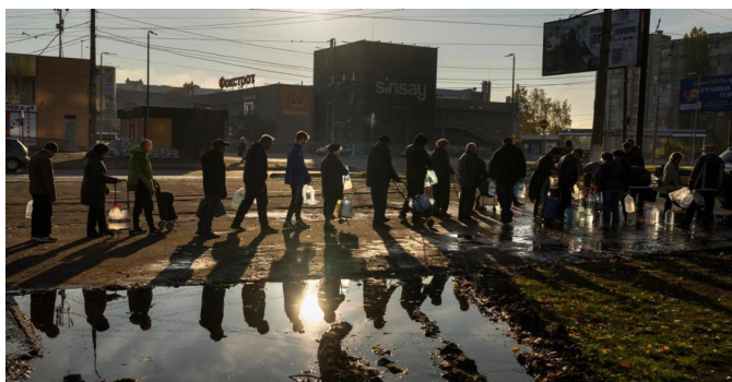
foto boven - lange wachtrijen in Kiev om een paar flessen met water te vullen.