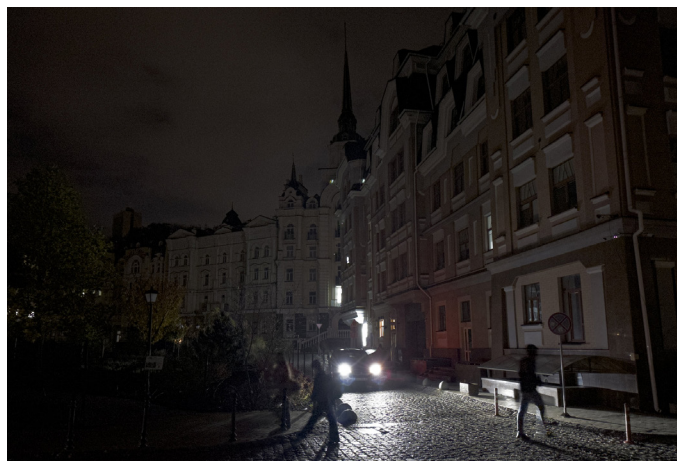
foto boven - de donkere straten van Kiev.

Gisteren geen stroom om mijn laptop en powerbank op te laden. Hoe moet ik nu werken? Maar tegelijk, als er stroom is moet ik ook snel andere dingen regelen die nodig zijn om te overleven. Werken moet ook, want ik ben afhankelijk van mijn minimale inkomen.