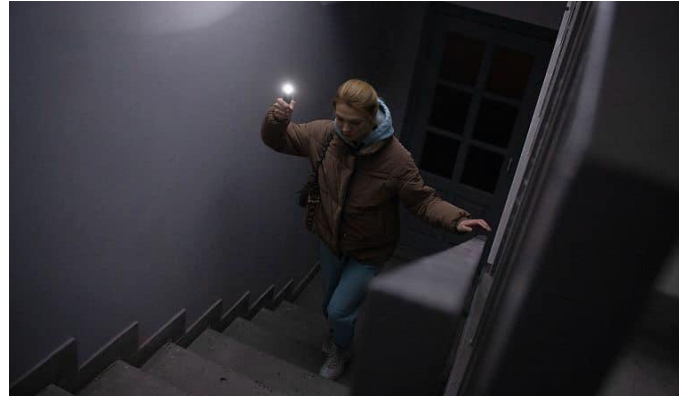
foto boven - geen licht in het trappenhuis.