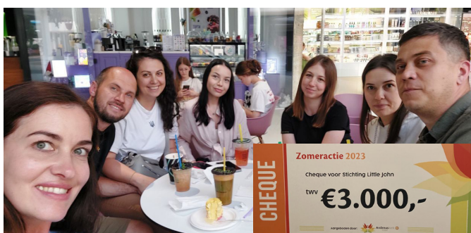
foto boven - het vrijwilligersteam van de gemeente in Hotov is blij met de cheque!

Little John ontving afgelopen september een mooie cheque van de Andreaskerk in Putten. Met de opbrengst van hun zomeractie houden wij deze winter de kerk in Hotov warm!